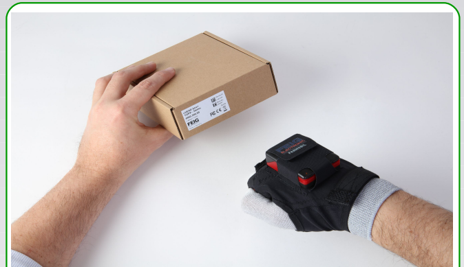
Scannen mit dem HyWear compact

Der FEIG HyWear compact ist die perfekte Verbindung aus Ergonomie und Effizienz. Mit mobiTOUCH 4.0 erhalten Sie passend dazu eine Software und Konfigurationsebene zur Verwaltung und Ausführung intralogistischer Prozesse mit der Hardware Ihrer Wahl.